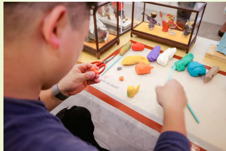
非遗传承人现场展示米塑技艺

非遗技艺展示环节中,非遗传承人现场展示了书中介绍的部分非遗作品,并通过视频短片让来宾感受到了非遗技艺的独特魅力。互动问答及媒体采访环节中,《江南非遗技艺》主创人员和非遗传承人代表与读者、媒体代表进行了深入交流。